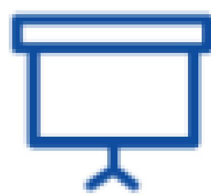
Tableau blanc multi-utilisateurs avec annotation et surlignage des diapositives

Téléchargement facile des documents (PDF, texte, images, PPT, .doc .xls)